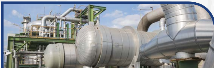
Resfriadores e Trocadores de Calor